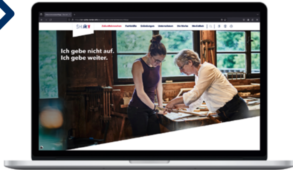
unternehmen-nachfolge.sh - das Online-Portal der Initiative